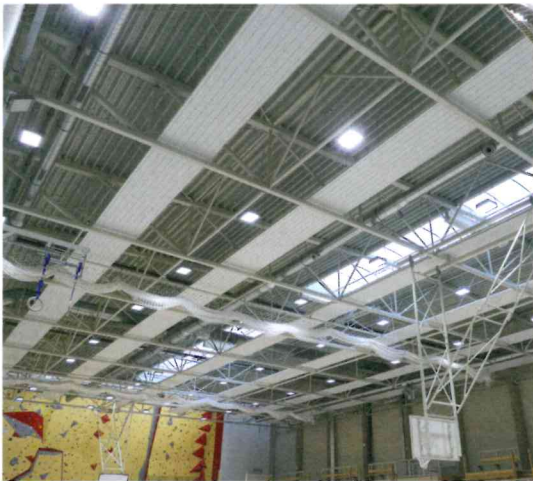
Kombination von Deckenstrahlplatten und LED-Leuchten an der Decke einer Industriehalle

nach Raumhöhe unter der Decke oder im hohen Seitenbereich. Eine Variante sind Warmwasser-Lufterhitzer, die an einen Wärmeerzeuger angeschlossen sind. Hier werden Wärmetauscher und Gebläse genutzt, um die warme Luft in die Halle zu bringen. Unabhängig von der Ausgestaltung des Systems wird aber immer das Medium Luft als Energieträger eingesetzt, um die Erwärmung einer Halle zu erreichen. Diese Konvektion funktioniert nur bei einem strömungsfähigen Stoff.