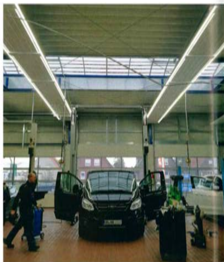
Die Paketlösung KSP to go lässt sich in kleineren Hallen einsetzen, auch in Kombination mit LED-Leuchten.

Über das praktische Online-Tool lässt sich rasch eine Auslegung abfragen. Anhand der Eckdaten wird das passende Produkt vorgeschlagen, das in einer stabilen Verpackung geliefert wird. Die Maße sind so ausgelegt, dass die Pakete in jeden Transporter passen. Mit geringem Aufwand und ohne spezielles Fachwissen kann der SHK-Handwerker die Elemente installieren. Die Plattenverbindung erfolgt mit Pressfittings, die Anschlussverrohrung wird einseitig ausgeführt. Die Langzeitgarantie von 10 Jahren rundet das außergewöhnliche Angebot ab. Optional lassen sich die KSP to go mit seitlich angebrachten LED-Leuchten zu einem Licht-Wärme-System verbinden.