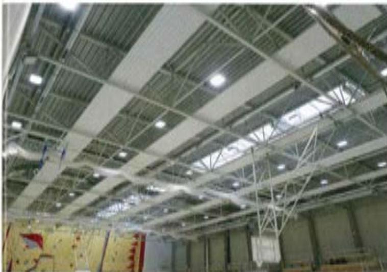
Flexibilität bei der Installation: Die Deckenstrahlplatten lassen sich in nahezu jede Dachkonstruktion einfügen.

ein Trägermedium für den Übergang von Heizfläche zum Raum nötig wäre. Das Prinzip entspricht der Sonnenstrahlung. Der Anteil an Konvektion ist gering, daher gibt es kaum Zugerscheinungen. Die Temperaturunterschiede im Raum fallen deutlich niedriger aus, was sich positiv auf die Behaglichkeit auswirkt, etwa an Arbeitsplätzen.