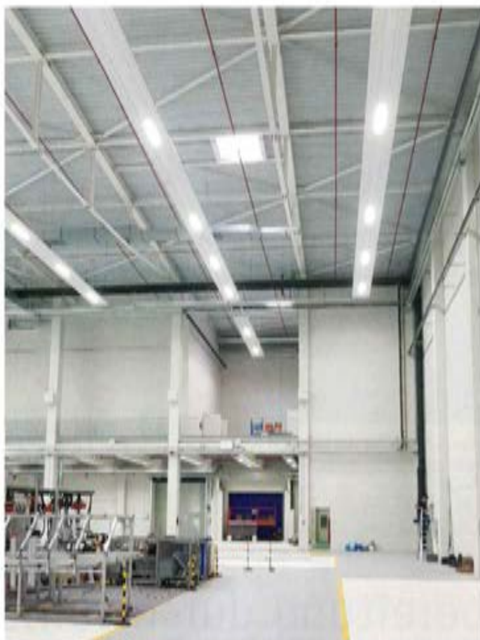
In dieser Industriehalle wurde eine Kombination von Deckenstrahlplatten und Premium-LED-Leuchten installiert.

Sowohl die Deckenstrahlplatten (DSP) als auch Lufterhitzer werden überwiegend im Segment Nichtwohngebäude (NWG) genutzt. Dies sind etwa Produktions- oder Lagerhallen sowie andere große Räume für gewerbliche oder industrielle Zwecke bis hin zu Sporthallen, Bürogebäude, Schulen oder Hotels zählen ebenfalls zum Segment, werden jedoch in der Regel mit anderen Heizsystemen und anderer Wär-