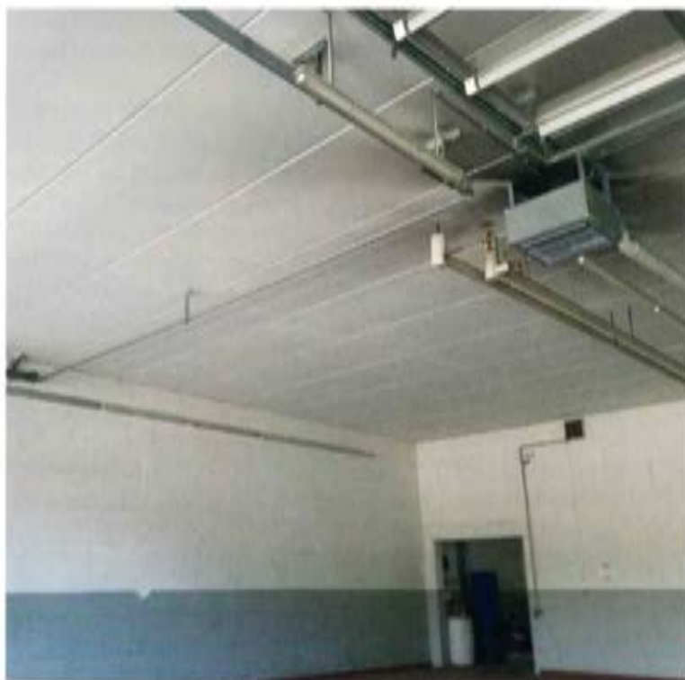
Der Luftherzter erwärmt die Werkstatt ungleichmäßig.