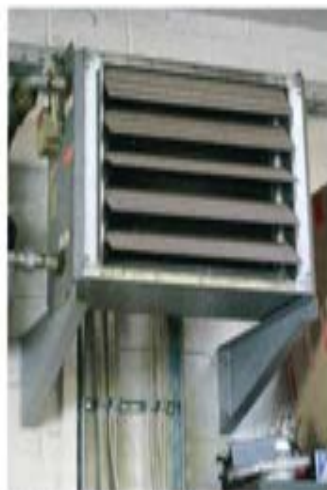
Ein Luftherzter gibt die erwärmte Luft durch die Lamellen in den Aufstellraum ab.

Besonders auffällig ist die Kombination aus Wärme und Beleuchtung, die nur mit einem solchen System gelingt. Dabei werden sparsame LED-Leuchten in die DSP integriert. Das führt bei ei-